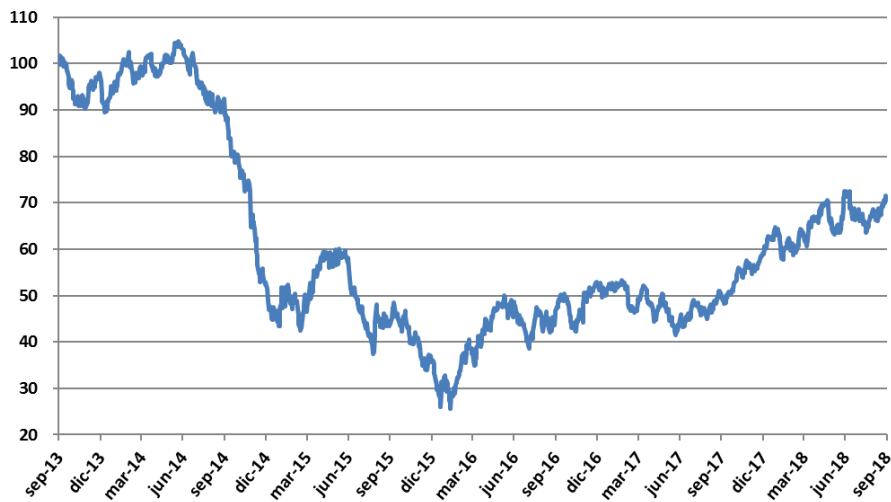
Precios del Petróleo West Texas (WTI) (Septiembre 2013 = 100)

La recuperación de 42% en los precios del petróleo entre el 3T17 y 3T18, de USD 51.67 a USD 73.25 por barril (como se aprecia en el siguiente gráfico) es un elemento que eventualmente debe favorecer la exploración y la perforación de nuevos pozos, así como la reactivación de algunos existentes. Se prevé que lo anterior, eventualmente facilitará enfrentar el complejo entorno del sector de petróleo y gas. Confiamos en que esta tendencia, aunada a las exitosas subastas de las rondas de la reforma energética en México, resulten en una reactivación de la exploración y perforación de pozos petroleros. Existe el riesgo, sin embargo, de que el desempeño de la actividad de petróleo y gas en México pudiera verse afectado por cambios en las políticas públicas en el sector energético a partir de diciembre 2018.